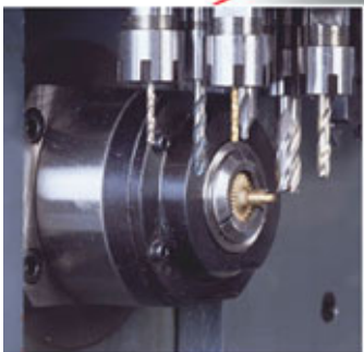
6支側面鑽銑刀具：側銑、鑽、攻牙加工