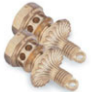
3支正面/背面偏心鑽銑刀具：正面偏心孔加工